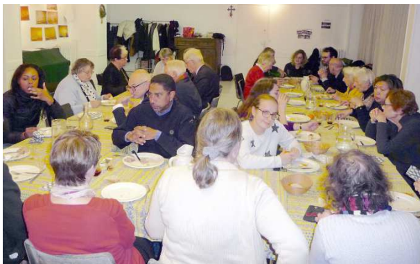
L'appétit et les conversations vont bon train !

Autour des tables, les conversations vont bon train pour réfléchir et échanger sur l'évolution de notre société. Ci-dessous, les participants sont à l'œuvre. Page suivante, le résultat de leurs travaux.