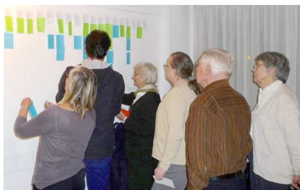
Affichage des commentaires sur les grandes tendances de la société