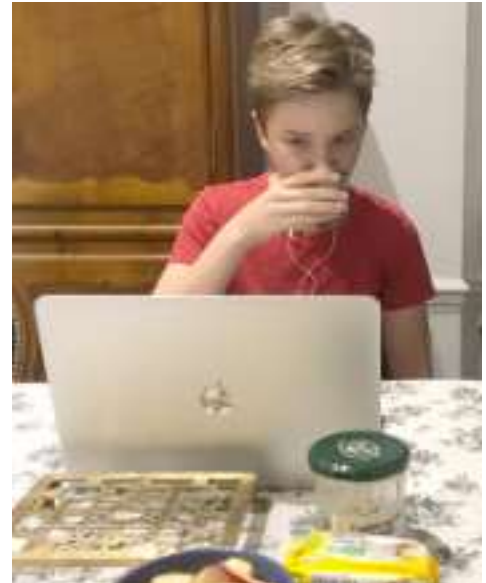
Changement d'environnement pour la séance d'instruction religieuse du 8 novembre par Teams.

En cette époque de confinement, plusieurs propositions de catéchèse pour vivre l'Avent et Noël à la maison vous sont proposés sur https://www.eglise-protestante-unie.fr/actualite/preparer-l-avent-a-la-maison-22929-n1297 .