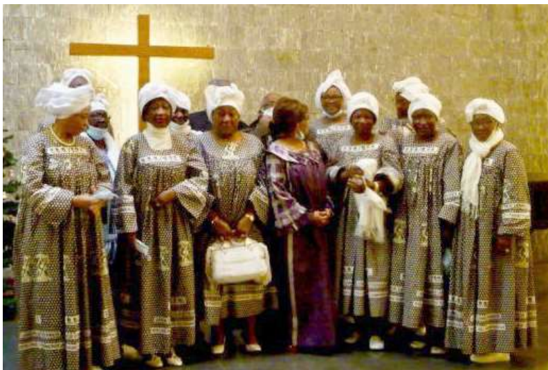
▲ Groupe de l'Église Évangélique camerounaise