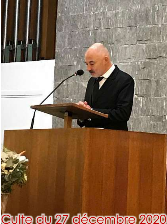
Culte du 27 décembre 2020