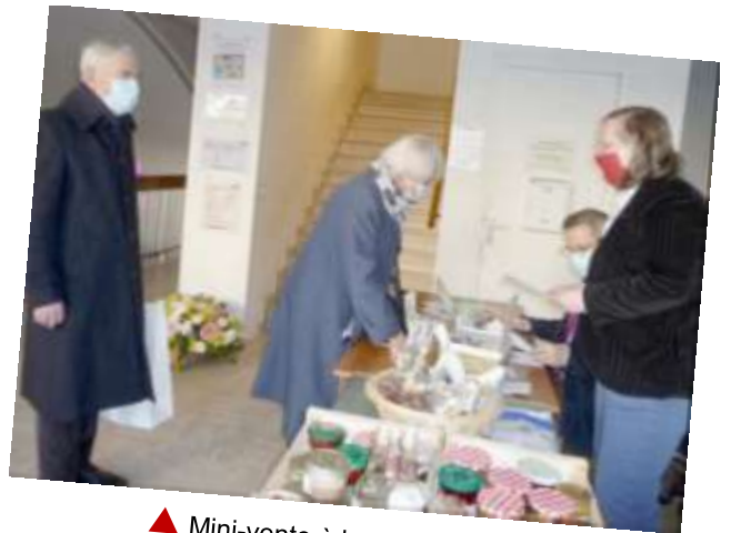
▲ Mini-vente à la sortie du culte