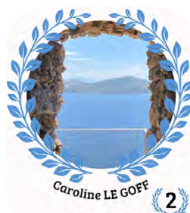
Caroline LE GOFF 2