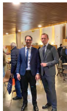
Le maire et ses adjoints ont profité de la vente