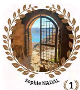
Sophie NADAL 1