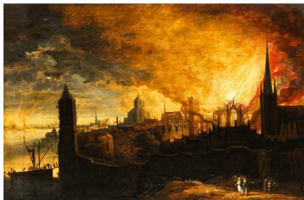
Loth et ses filles fuient Sodome en feu avec l'ange Daniel van Heil , 1650.

https://commons.wikimedia.org/wiki/File:Daniel_van_Heil_(attr)_Brennende_Stadt.jpg