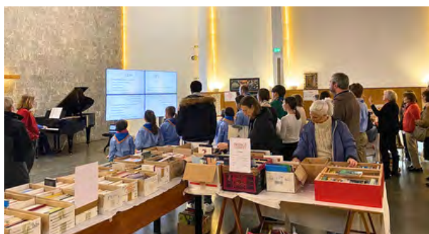
Chants de Noël et Chants scouts