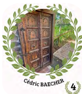
Cédric BAECHER 4