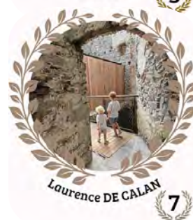
Laurence DE CALAN 7